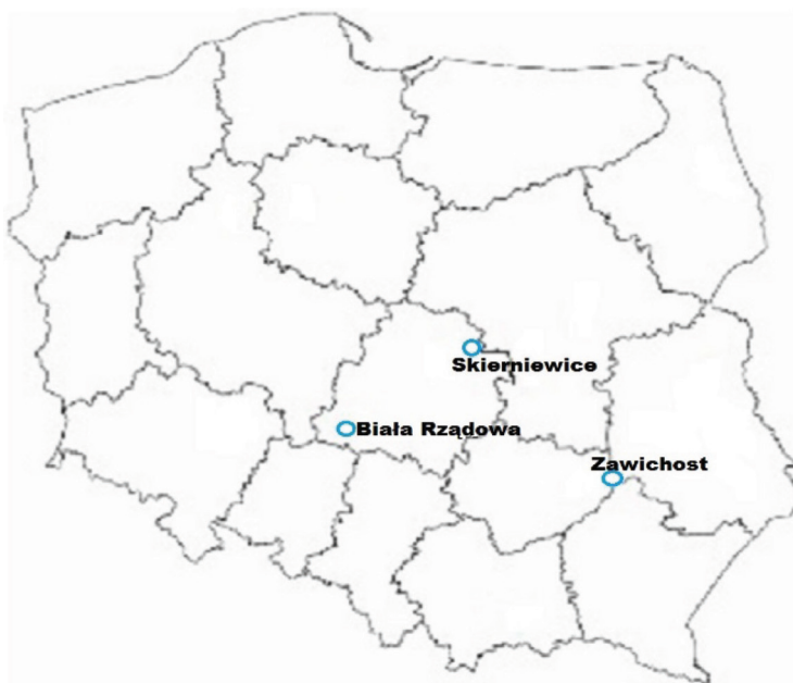
Rysunek.1. Lokalizacja stacji meteo uwzględnionych w badaniach.

Celem opracowania jest ocena potrzeb wodnych jabłoni oraz wysokości opadów efektywnych co pozwoli na określenie potrzeb nawadniania tak ważnego dla gospodarki gatunku roślin sadowniczych. Dane meteorologiczne obejmujące okresy wegetacyjne od maja do września w latach 2011 – 2016. Dane pochodziły z trzech automatycznych stacji meteorologicznych (iMetos – Pessl Austria) rozmieszczonych w różnych regionach Polski: Skierniewice (N-51°57', E-20°09'), Biała Rządowa (N-51°15', E-18°27') i Zawichost (N-50°48', E-21°51').